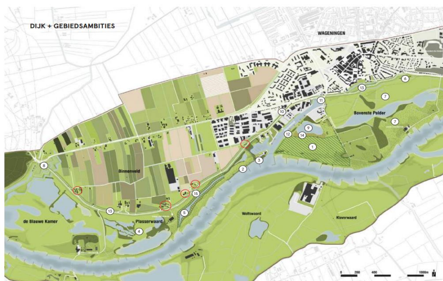
Figuur 1: plangebied dijkversterking en gebiedsambities Grebbedijk (bron: MER)

De Grebbedijk tussen Wageningen en Rhenen voldoet niet meer aan de geldende veiligheidsnormen. Het waterschap Vallei en Veluwe wil daarom de dijk versterken. Deze versterkingsopgave is voor de betrokken partners aanleiding om ook bestaande (gebieds)ambities op het gebied van natuur, recreatie, duurzaamheid, economische ontwikkeling en ruimtelijke kwaliteit te realiseren.